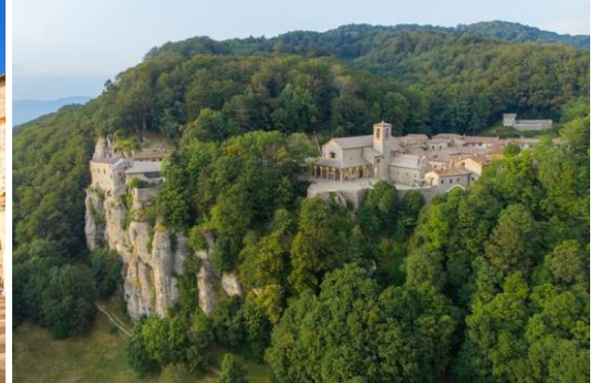
La Verna (Monte Alverne) - Itália