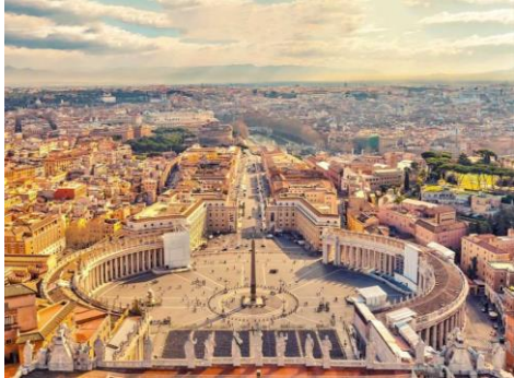
Roma - Itália