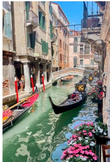
Veneza - Itália