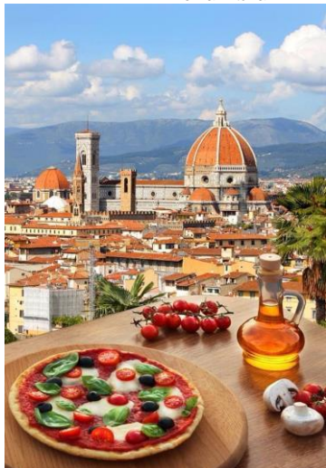
Florença - Itália