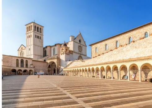
Basílica São Francisco de Assis - Itália